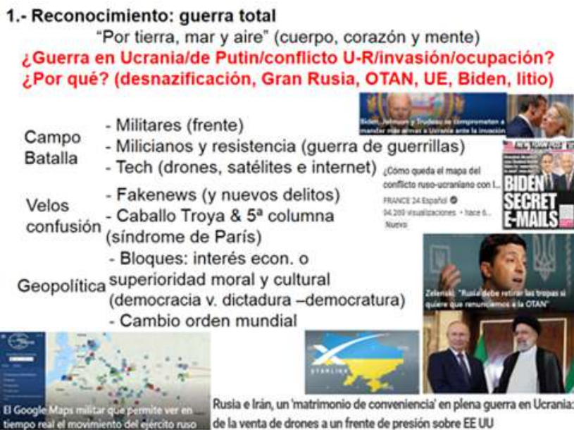
Figura 3. Valoración de la guerra

se aludió a los tratados internacionales favorecedores de la reunificación alemana, donde se renunciaba al avance hacia el este de la OTAN, sin embargo, se insiste, fue firmado por otros actores. Por último, ¿desde cuándo un país, de manera imperialista, puede impedir a otros que ejerzan su soberanía? ¿A caso Ucrania no puede incorporarse a la Unión Europea y a la OTAN sin permiso de Rusia? (entonces estaríamos negando el Derecho Internacional). Ningún país puede imponerle a otro unas condiciones de ese tipo. Además eso fue con la URSS, que ya se extinguió, luego Rusia no tiene que decir nada a ese respecto (sobre la posible entrada de Ucrania en la OTAN y/o la Unión Europea); sin embargo, tal cosa sí se le prometió a Ucrania por parte de la comunidad internacional, en reiteradas ocasiones, y por ello, Ucrania permitió que se ocupara parte de su territorio (Crimea), la entrega de armas nucleares, y tuvo lugar EuroMaidan (manifestaciones populares a favor del ingreso en la Unión Europea) –tal como se puede ver en las imágenes–.