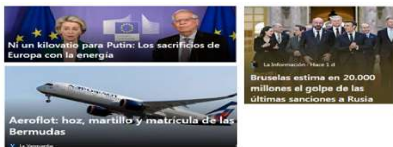
Figura 11. Balance de la guerra V

estamos además sobre endeudados en fin, va a ser tremendo, aún estoy esperando efectivamente ver los efectos con las divisas digitales porque es verdad que salvo el tema de los rublos, ya que a Rusia le siguieran pagando el gas y el petróleo en rublos, y además al dejar de utilizar los dólares, ha hecho que también se desplome del Euro frente al Dólar, ya no solamente porque la Reserva Federal haya subido los tipos de interés, sino porque ahora mismo se está revalorizando el dólar, pues nos sale muchísimo más caro de ahí que al final pues aunque empiecen ya a bajar los precios, nos sigue saliendo carísima la gasolina. En fin, ya les digo que todas las sanciones que se han tomado desde la Unión Europea en realidad miren, las compañías aéreas lo que han hecho ha sido matricularse en Bermudas y ya está, por otro lado, lo que hacen es que todo el gas y el petróleo lo compra India y luego nos lo revende. Por su parte, Rusia tampoco puede coger y ponerse a vender a otras partes del mundo, porque en realidad los gasoductos los tiene tendidos hacia Europa, entonces, hasta que se construya y pueda realmente pasarles a China e India, etc., pasará mucho tiempo, por tanto, en cierto modo todos estamos entrampados.