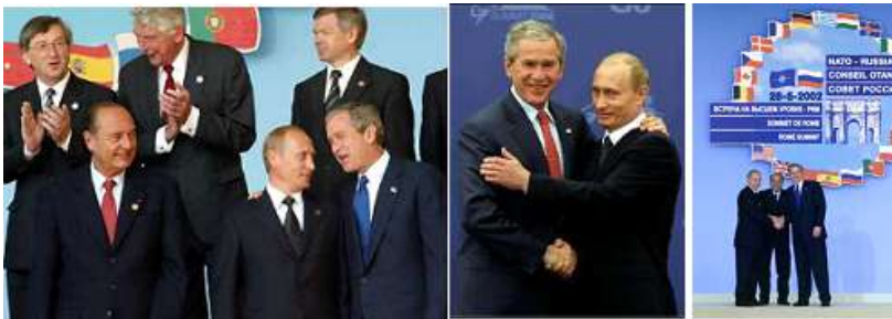
Figura 16. Imágenes y datos que matan el relato I

Son muchos los puntos tratados por el otro ponente, que merecen una reconsideración (incluso una rectificación), pero empezaré por lo planteado por el moderador: Rusia sí fue candidata a entrar en la OTAN (véase la foto de Putin y Bush en el año 2002), planteándose incluso su incorporación al proceso de integración europea, en concreto, en la Unión Europea (desde 1992 con el tratado de Maastricht, cuando se prevé que vaya a tener personalidad jurídica, pero no se perfecciona hasta el Tratado de Lisboa y su entrada en vigor en 2009).