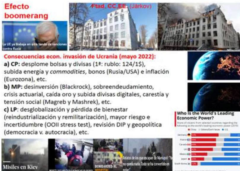
Figura 10. Balance de la guerra IV