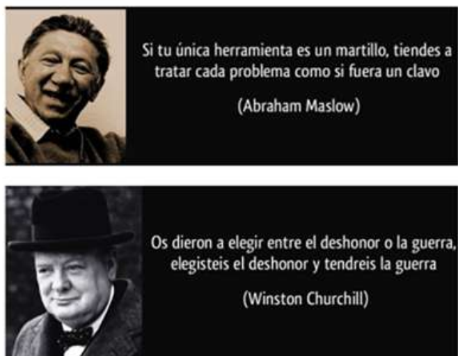
Figura 2. Reflexiones preliminares