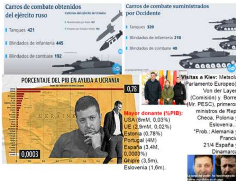
Figura 8. Balance de la guerra II

que todo mayor de 18 años se tenía que quedar a combatir, salvo que tuvieras 3 hijos o más y, entonces, si te dejan irte con tu familia. Luego de tales medidas, el Ejército ucraniano desplegó su contraofensiva, y están recuperando más de 41 localidades, van a una media de no menos de 10 km a la semana, porque también hay campos minados, se van volando puentes también, etc. Hay una imagen en Twitter que cambió la percepción, que eran pues los rusos ya les digo, si es que los pobres tampoco sabían dónde iban y además les estuvieron bombardeando con propaganda de que los ucranianos son rusos también, y vamos a ayudar a nuestros hermanos rusos etc., claro, cómo van a disparar a ucranianos, entonces, se encontraron en una situación tremendamente loca y aquí lo que están es desde un tanque pidiendo rendirse con la ropa interior, que es la bandera blanca. Pero bueno ¿Sabían quiénes han sido el mayor suministrador de armamento de Ucrania en esta guerra? pues lo crean o no ha sido Rusia.