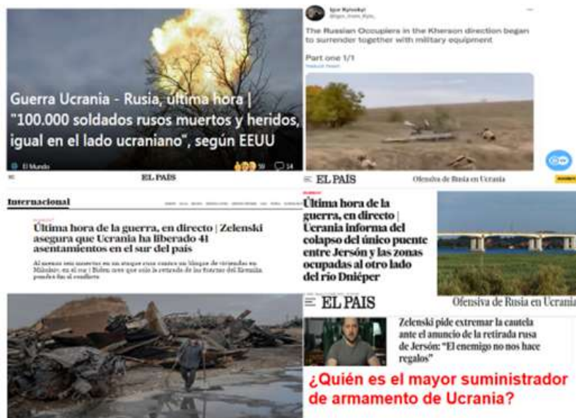
Figura 7. Balance de la guerra I

metió a sus camaradas de la KGB y otros tantos “hombres fuertes”, que es lo que significa Siloviki y, los puso en los puestos importantes de las grandes empresas públicas, entonces claro el problema es eso, que estaba acostumbrado a la anexión de Crimea que fue rápido relámpago o la auténtica brutalidad y la impunidad después de eso, como fueron sus intervenciones en Siria, Libia, Malí, Georgia, etc. ¿Qué es lo que ocurrió realmente?