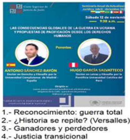
Figura 1. Sumario