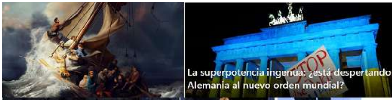
Figura 17. Imágenes y datos que matan el relato II