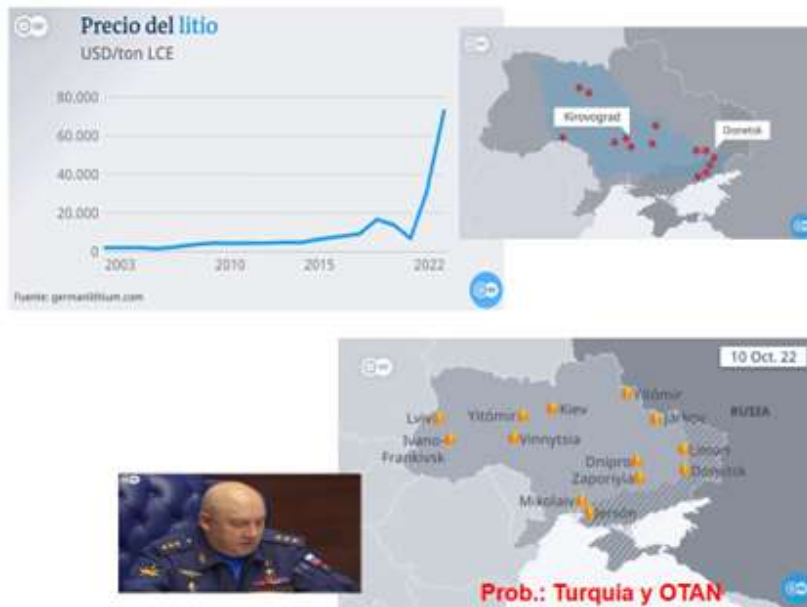
Figura 4. Depósitos de litio

trabas Macron, y diciendo que bueno, no se puede humillar a Putin, hay que darle una salida, por tanto ahí siempre tenemos en Europa esa quinta columna. Por último, temas de geopolítica lo vamos a ver en los bloques, que no solamente es una cuestión de intereses económicos, sino también la superioridad moral y cultural, lo que está en juegos es qué modelo vamos a tener porque además hay un cambio del Orden Mundial, y por tanto democracia duras o como los queramos llamar. Rápidamente aquí tienen (vid. diapositiva).