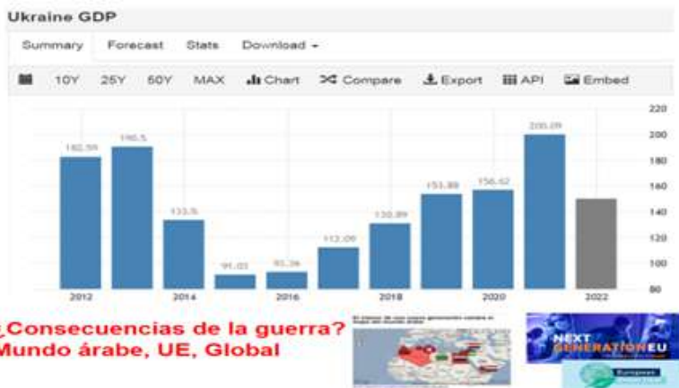
Figura 9. Balance de la guerra III