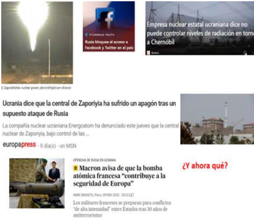
Figura 15. Resultados de la guerra IV

Como puede constatarse en las fotos (v.g. torturas, fosas comunes), resulta que en Ucrania se ha cometido grandes atrocidades sobre todo en Leopoldis, Mariupol, etc. Ha habido auténticas barbaridades y sobre todo contra civiles, pero repito por eso cuidado también con la terminología como llamamos al fenómeno y según la situación en la que estamos (vid. presentación al inicio). No sé si esto crece, vengan los ataques nucleares, el armamento nuclear que tiene Rusia no es de última generación, no me extrañaría que incluso hasta les pudiera accidentar a ellos al intentar lanzarlo, nosotros tenemos escudos que pueden frenar cualquier tipo de ataque, en ese sentido a mí me preocupa más la situación de las centrales nucleares como la de Zaporíya, que tiene 5 o 6 grandes reactores, y por los bombardeos se han quedado sin electricidad y con ello sin posibilidades del mantenimiento, lo que puede causar la fisión del núcleo y, ahí podemos tener un problema muy gordo.